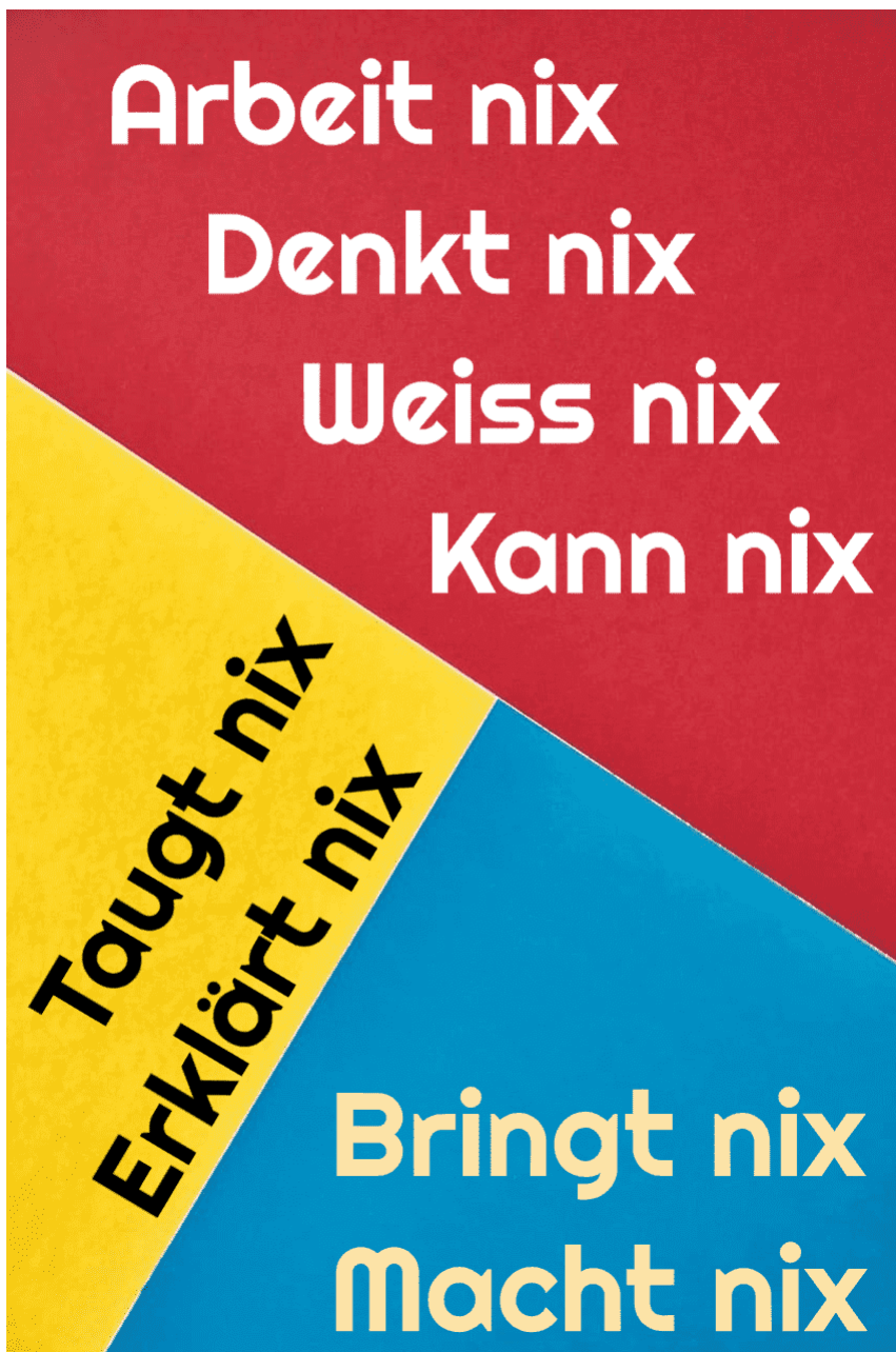
[11]6. Der Vorteil der Klugheit besteht darin, dass man sich dumm stellen

5. "Zu nix zu gebrauchen, aber zu allem fähig." Die Textgrafik besteht nur aus einfachen geometrischen Formen und Text. Sie erreichen keine Schöpfungshöhe, die für urheberrechtlichen Schutz nötig ist, und sind daher gemeinfrei. Dieses Bild einer einfachen Geometrie ist nicht urheberrechtlich und daher gemeinfrei, da es ausschließlich aus Informationen besteht, die Allgemeingut sind und keine originäre Urheberschaft enthalten. > This image of simple geometry is ineligible for copyright and therefore in the public domain, because it consists entirely of information that is common property and contains no original authorship.