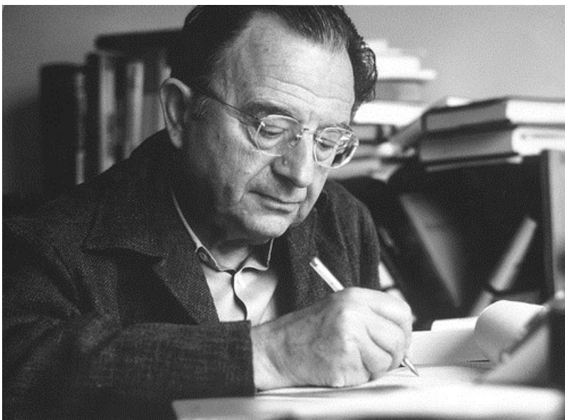
Der Begriff selbst – das Ausgebranntsein – passt

Psychodynamisch betrachtet, versuchen sie mit allem, was sie tun, das internalisierte Bedrohliche zu beschwichtigen und in Schach zu halten. Je rücksichtloser sie mit sich und ihren eigenen Bedürfnissen, Ressourcen und Kräften umgehen, desto weniger müssen sie sich vom internalisierten Aggressor bedroht fühlen und desto erfolgreicher sind sie zugleich beruflich. Da dem Menschen nicht nur körperlich Grenzen gesetzt sind, sondern auch psychisch, kommt es schließlich zu einer Art Dekompensation, die als Burnout in Erscheinung tritt.