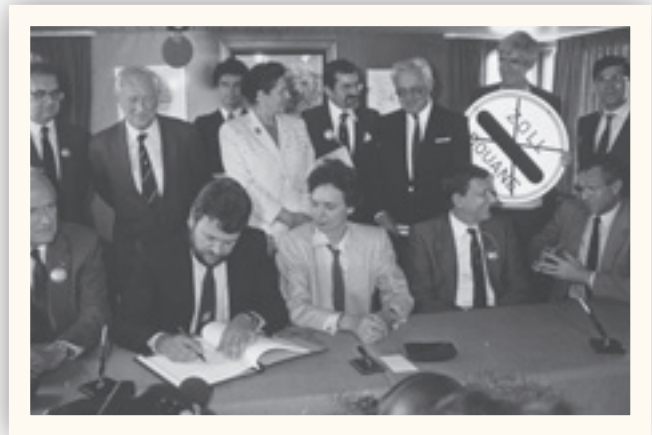
Jean Weyrich, Archives Luxemburger Wort

Abschaffung der Kontrollen an der Grenze zu Österreich (Unterzeichnung des Übereinkommens im April 1995)