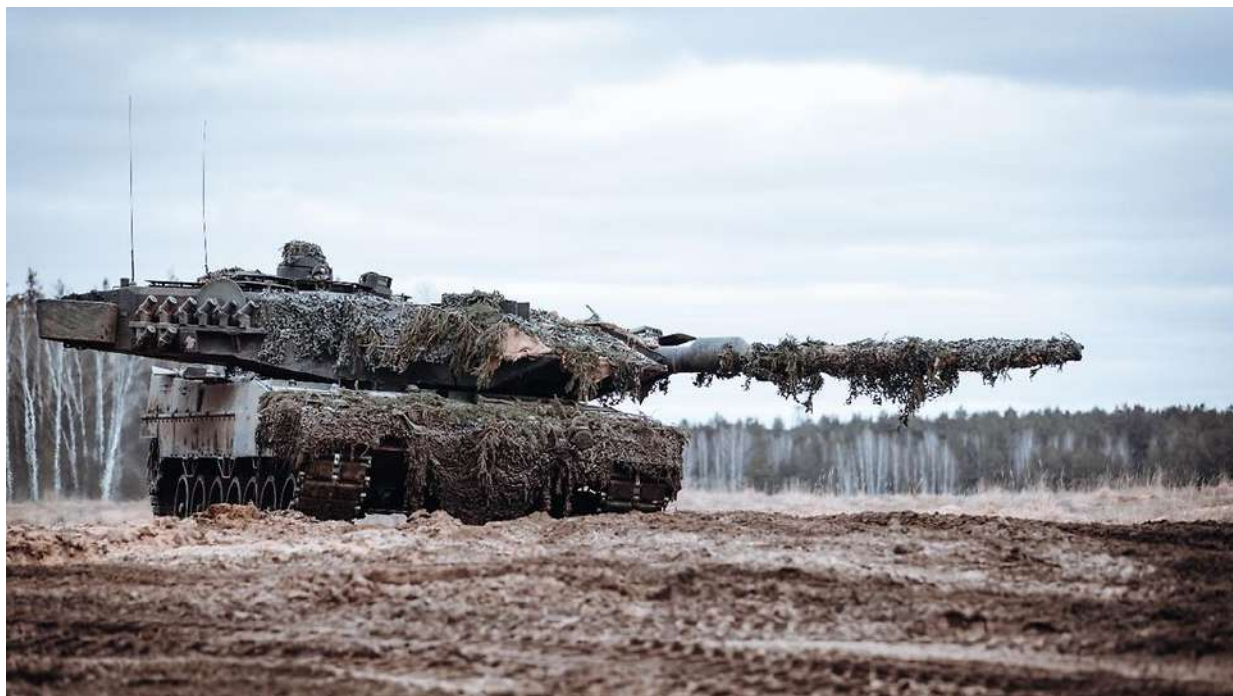
Deutschland hat der Ukraine Kampfpfpanzer vom Typ Leopard 2A6 geliefert.