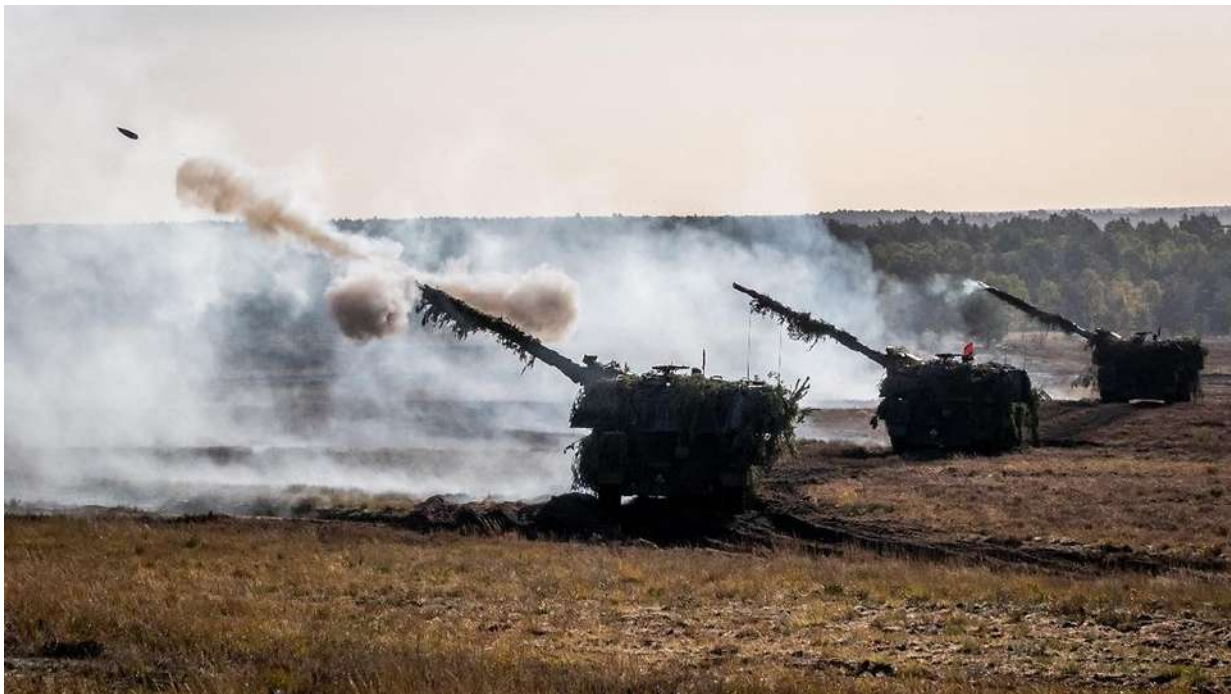
Panzerhaubitzen 2000 bei einer Ausbildungs- und Lehrübung.