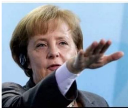
Chancellor Angela Merkel announced that her country will send 500 new troops to