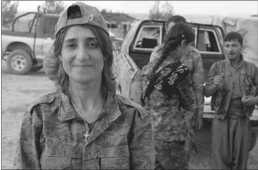
Suryoye YPJ-Kämpferin in Serêkaniyê