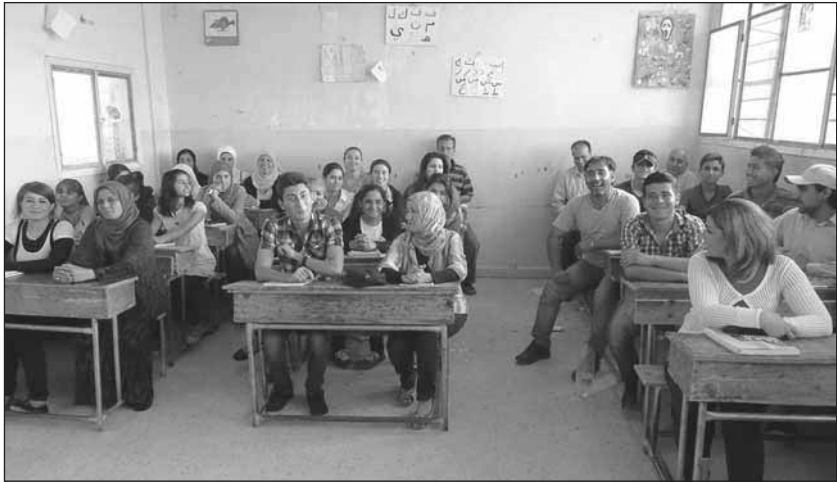
Kurdischkurs in Serêkaniyê