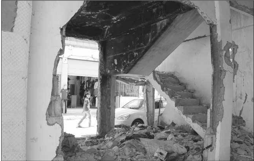
Zerbombtes Haus in Tirbespî

Die Revolution in Rojava ist nicht ohne den Kontext des syrischen Aufstands von 2011 zu erklären. Daher muss hier zunächst auf den Aufstand in Syrien eingegangen werden. Vorneweg ist zu sagen, dass dies im Rahmen dieses Buches nur in kurzer Form geschehen kann, mit dem Fokus auf die Folgen für die Regionen Rojava.