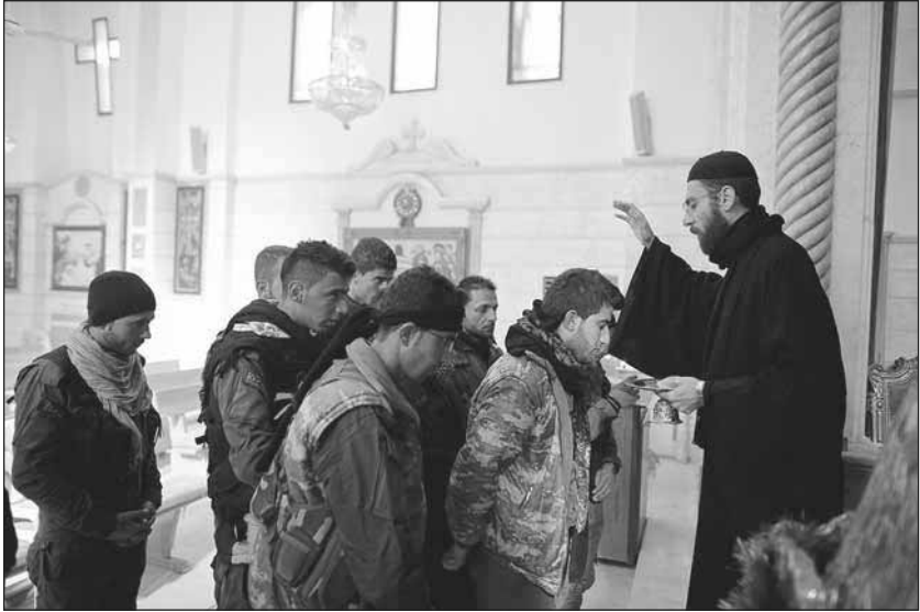
MFS-Kämpfer werden von einem Suryoye-Priester gesegnet, Weihnachten 2014 in Dêrik