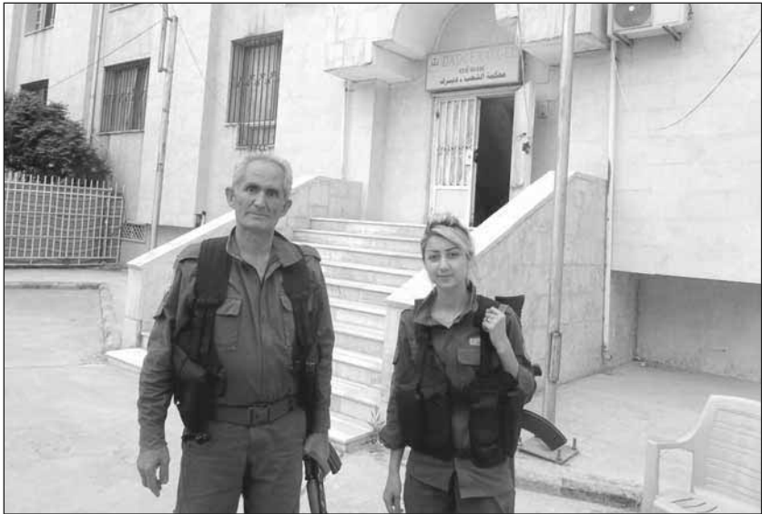
Gericht in Dêrik

Mit der im Juli 2012 begonnenen Revolution von Rojava ist dort auch das syrische Rechtssystem weitgehend hinfällig geworden. Selbstverständlich hat die Bevölkerung und die dahinter stehende politische Bewegung neben dem Sicherheitsapparat, den politischen Vertreter_innen des Staates und den Geheimdiensten auch die Vertreter_innen der Justiz abgelehnt und aus ihren Ämtern entfernt. Genauso wichtig wie das Entfernen der Repräsentant_innen des diktatorischen Baath-Regimes ist allerdings die Frage, wie eine neue Form von Justiz aussehen kann. In jeder nicht vollkommen herrschaftslosen und geschlechterbefreiten Gesellschaft kommt es – wenn auch auf niedrigem Niveau – zu so genannten Straftaten, besonders vor dem Hintergrund einer Kriegssituation, d.h. Streitigkeiten, Gewalt, Raub und Ausbeutung, mit denen die Gesellschaft umgehen muss.