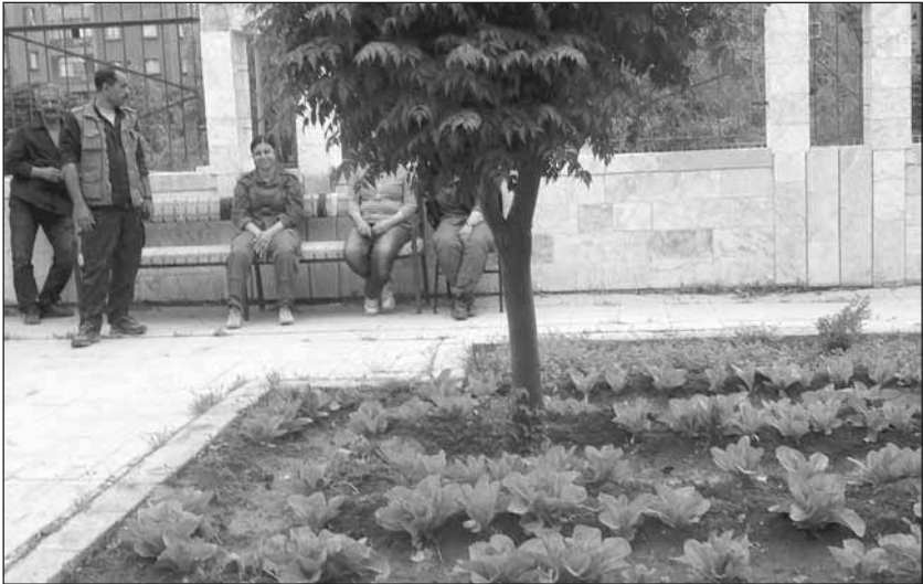
Überall Urban Gardening gegen das Embargo, hier im Hof des Wirtschaftsministeriums in Dêrik

tionäre Jugend versucht der Flucht durch Bildung entgegenzuwirken. Die ohnehin kleinen Flüchtlingskontingente in Europa werden nicht etwa mit Flüchtlingen aus den schwer umkämpften Gebieten wie Homs oder Hama gefüllt, sondern mit Menschen aus dem relativ sicheren Rojava, um dieses entsprechend der Wünsche der Türkei zu entvölkern, die sich die kurdische Frage vom Hals schaffen will.