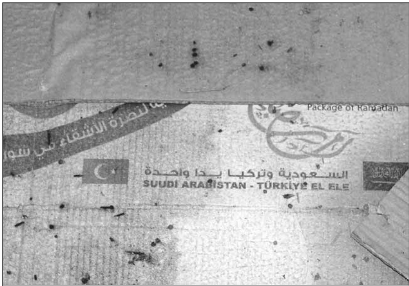
Entdeckung in einem IS-Ausbildungslager, Aufschrift: Saudi-Arabien und Türkei Hand in Hand

kämpft und ihn vertrieben. Darauf muss jetzt die politische Einheit folgen. Nur so können wir verhindern, dass Kurdistan erneut Schauplatz eines brutalen Krieges der regionalen und globalen Mächte wird. Daher müssen wir, ähnlich wie in Rojava auch in der Autonomen Region Kurdistan unseren eigenen Weg finden.« 438