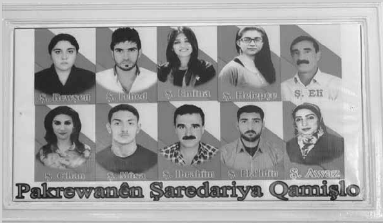
Stadtverwaltung von Qamişlo, die Gefallenen