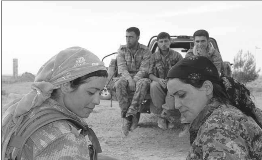
YPJ-Kämpfer_innen bei Serêkaniyê

lichkeit den fortschrittlichen Charakter des Projektes der demokratischen Autonomie aufgezeigt und viel zur internationalen Solidarität mit Kobanî beigetragen. Im Gegensatz zu den Peşmerga gibt es keine Combat Exclusion für Frauen. Die Beteiligung von Frauen im bewaffneten Kampf wird als strategisch angesehen, denn es ist klar, solange sie nicht in jedem Bereich des Kampfes und der Institutionen beteiligt sind, können sie Geschlechtergleichwertigkeit nicht erreichen. Ihr Kampf findet im Herzen einer revolutionären Kultur statt, die einen radikalen Wandel der Geschlechterrollen im Mittleren Osten zum Ziel hat, damit ist ihr Kampf ein universeller Kampf geworden. Die Tatsache, dass die Selbstverteidigungskräfte den Jihadisten waffentechnisch stark unterlegen sind, da diese mit modernstem Material, überwiegend aus US-Beständen ausgerüstet sind, führte nicht zur militärischen Unterlegenheit, denn die Selbstverteidigungskräfte kämpfen mit sehr viel größerer Motivation als die Söldner des IS und der Al-Nusra-Front, die oft zwangsrekrutiert und unter Drogen regelrecht verheizt werden. Denn es geht ihnen um die Verteidigung ihrer Heimat und eines langgehegten Traumes: nämlich um die Demokratische Autonomie.