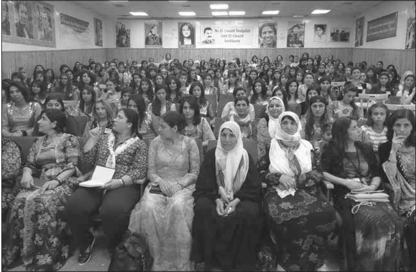
Konferenz der jungen revolutionären Frauen in Rimelan (Mai 2014)

»Vielleicht ist dies das erste Mal in der Geschichte, dass Frauen eine solch aktive Rolle in der Organisation einer Revolution gespielt haben. Sie kämpfen an der Front, fungieren in Kommandopositionen und nehmen an der Produktion teil. Es gibt keinen Ort in Rojava, an dem keine Frauen zu sehen sind. Sie sind überall und ein Teil von allem.« 172