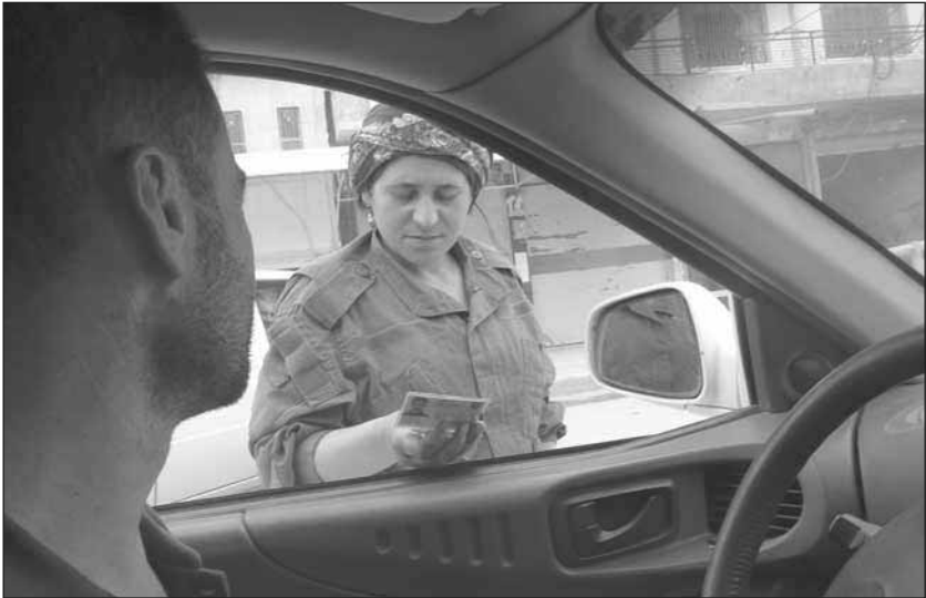
Asayîşa Jin – Straßenkontrolle der Frauensicherheitskräfte in Tirbespî

hen. Die jungen Frauen, wie auch die Männer, wohnen quasi in den Asayîş. Sie leben und arbeiten dort zusammen, gehen nur selten nach Hause. Die meisten arbeiten ehrenamtlich, d.h. sie bekommen nur ihre Kleidung, ihr Essen und ein geringes Taschengeld. Sie führen ein kollektives Leben im Dienste der Bevölkerung und zum Schutz des Systems der demokratischen Autonomie. Gibt es in ihrer Stadt Angriffe von außen, sei es durch den IS oder die syrische Armee, stehen sie an der Seite der YPG und YPJ.