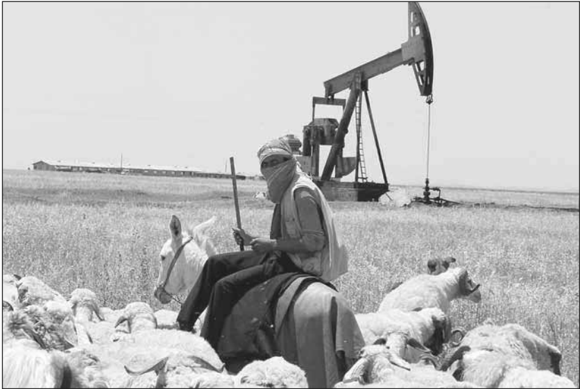
Öl, Weizen und begrenzte Viehwirtschaft prägen den Kanton Cizîrê.