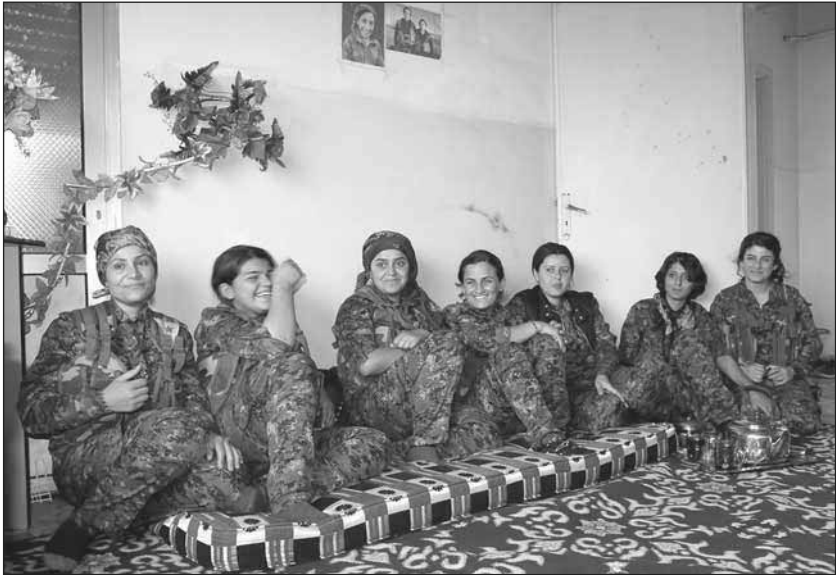
YPJ-Kämpfer_innen bei Serêkaniyê.

»Die Terrormiliz IS hat nicht nur die Wertlosigkeit der militärischen Überlegenheit der Staaten der Region und des Westens, sondern auch die Inhaltslosigkeit ihrer Werte zur Schau gestellt. Der militärische Fall Kobanîs könnte schmerzlich sein. Schmerzlicher sind aber die gefallenen Kämpferinnen und Kämpfer. Sie haben nämlich mit ihrem beispiellosen Kampfgeist der ganzen Welt ihre moralische Überlegenheit gezeigt und die Glaubwürdigkeit der Weltgemeinschaft auf den Prüfstand gestellt. Die Kurden werden vielleicht eine Stadt verlieren, aber die Weltgemeinschaft hat bereits alle ihre Werte verloren.« 244