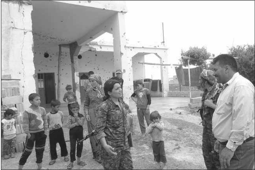
Zerstörtes Dorf bei Til Xelef. Erst vor 20 Tagen konnten die Bewohner_innen in ihr von YPJ- und YPG-Einheiten befreites Dorf zurückkehren (Mai 2014)