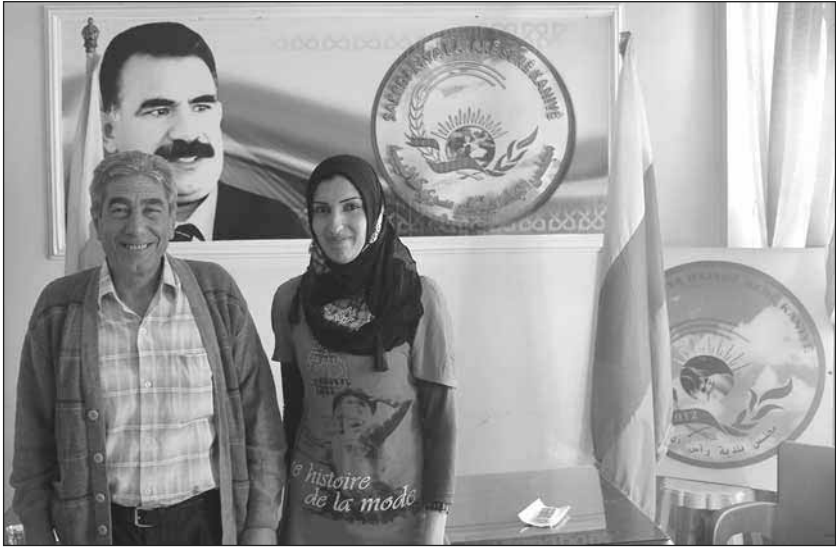
Das Prinzip der Doppelspitze: Bürgermeisterin und Bürgermeister von Serêkaniyê

nicht alle Teile der Gesellschaft vertreten sind! Wie können sie von Freiheit und Demokratie sprechen und dabei die Gleichberechtigung von Frauen und Männern einfach übergehen? Wie kann eine Gesellschaft frei sein, in der die Frauen nicht frei sind? [...] Wir sind noch lange nicht an unserem Ziel angekommen. Dessen sind wir uns durchaus bewusst. Wir haben aus den Fehlern vergangener Revolutionen gelernt. Es hieß immer: ›Lass uns die Revolution zum Erfolg bringen, danach werden wir den Frauen schon ihre Rechte geben.‹ Nach der Revolution ist das natürlich nie geschehen. Wir werden allerdings nicht zulassen, dass sich das bei unserer Revolution wiederholt.« 193