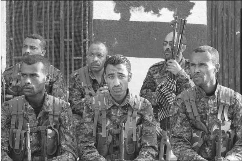
Mitglieder einer arabischen Einheit, Til Koçer

»Für die Freiheit und den Respekt vor dem Glauben, geben wir als Kurd_innen, Araber_innen, Suryoye (Assyrer_innen, Chaldäer_innen und Aramäer_innen) Turkmen_innen und Tschetschen_innen diesen Vertrag bekannt. [...] Die Regionen der demokratisch-autonomen Verwaltung sind offen für die Beteiligung aller ethnischen, sozialen, kulturellen und nationalen Gruppen mittels ihrer Vereinigungen sowie die darauf aufbauende Verständigung, die Demokratie und den Pluralismus.«