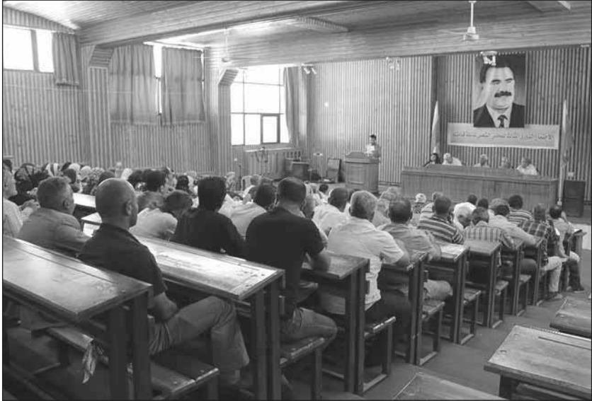
Ratsversammlung der Stadt Qamişlo